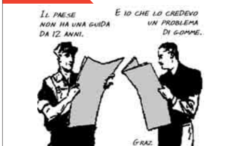
IL PAESE NON HA UNA GUIDA DA 12 ANNI. E IO CHE LO CREDEVO UN PROBLEMA DI GOMME.

NON SI CONTANO LE VITTIME, DIMESSO IL PREMIER